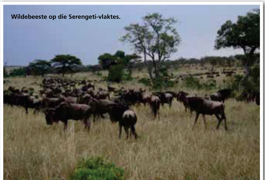
Wildebeeste op die Serengeti-vlaktes.